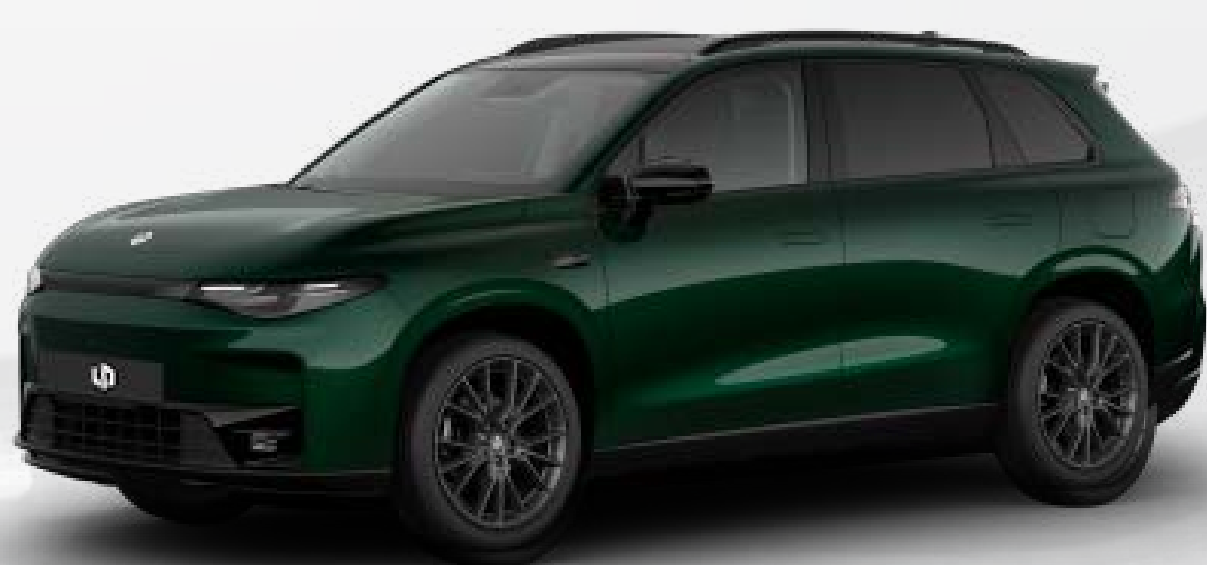
● ירוק מטאלי