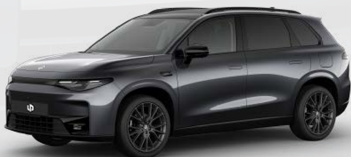
● אפור מטאלי