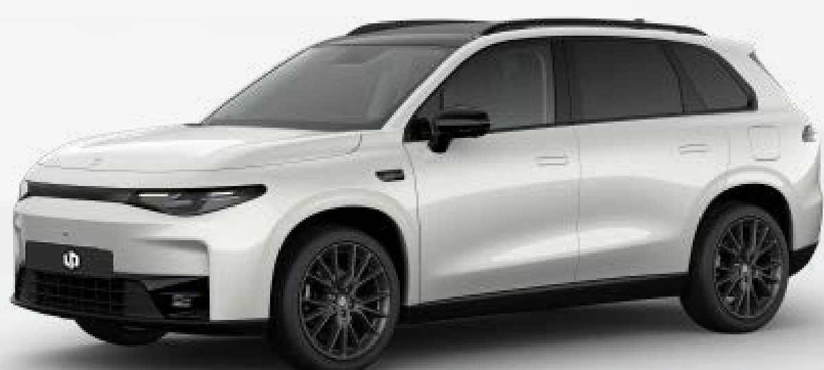
● לבן פנינה