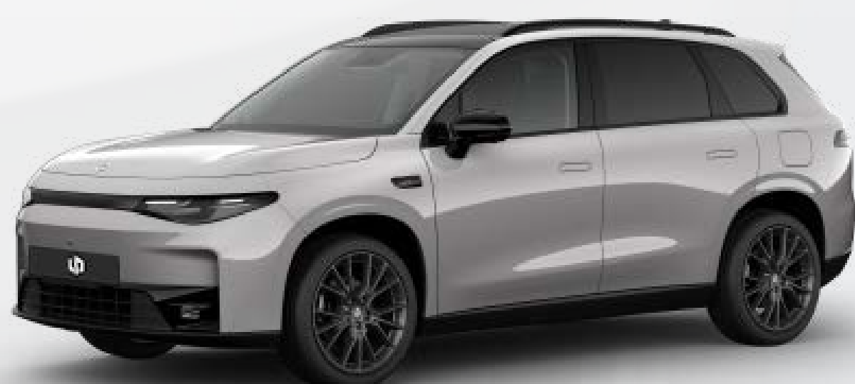
● אפור בטון