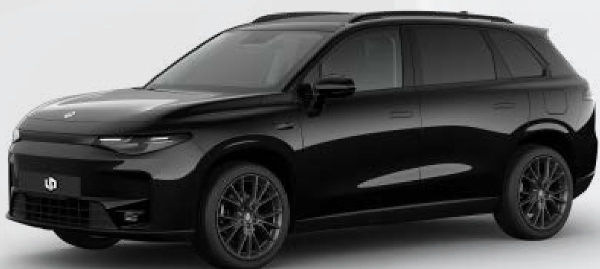
● שחור מטאלי